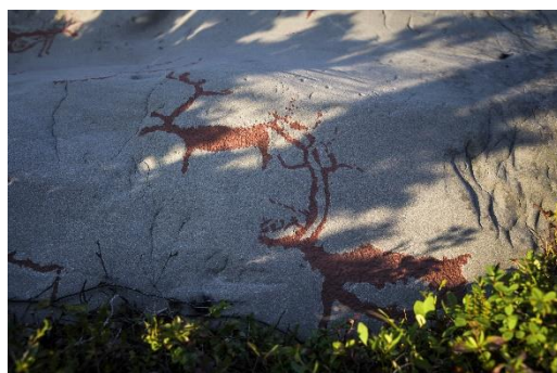
Hällristningar i Alta (CH - Visitnorway.com)